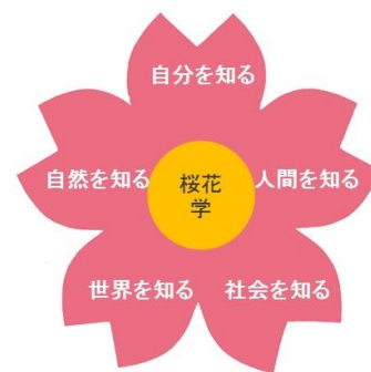
図2 「桜花学」の概要図

「桜花学」の学修を通して、人間存在および人間の生み出した文化を広く理解し、変化・発展しつつある現代社会の課題を女性の視点をふまえて理解しうる基礎的・総合的視野を養います。以て「心豊かで、気品に富み、洗練された近代女性」としての「信念ある女性」の基礎を培うことが期待されます。